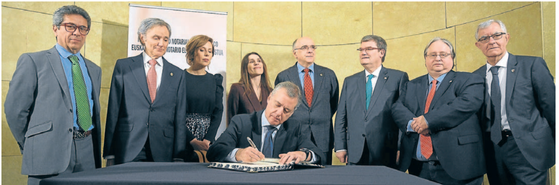
El lehendakari inauguró los actos de celebración del décimo aniversario con su firma en el Libro de Honor.