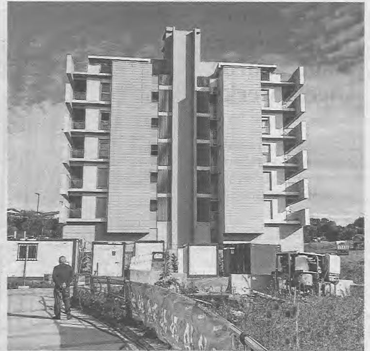
En la CAV la hipoteca para primera residencia no paga.

Se falle lo que se falle, los consejeros delegados de los bancos coinciden en que no contemplan la posi-