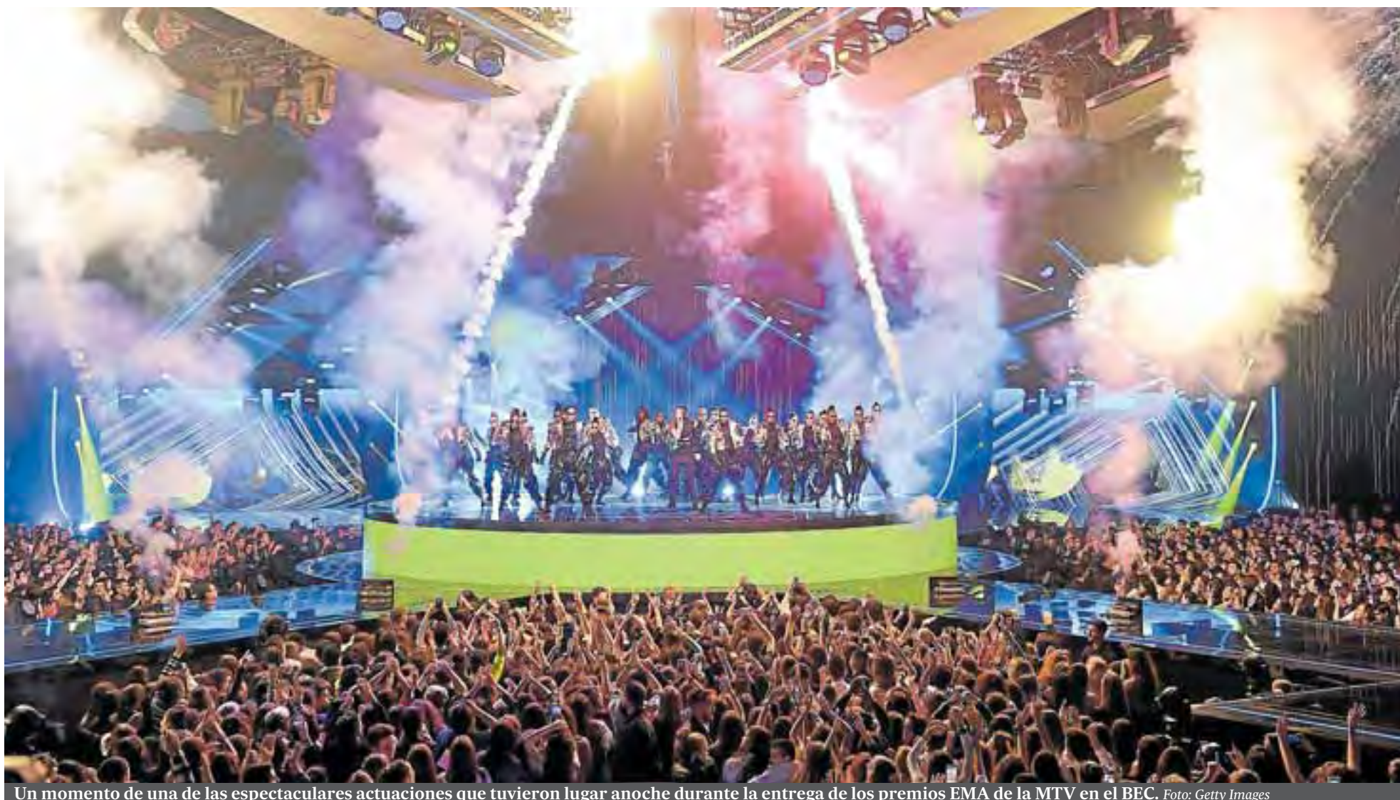
Un momento de una de las espectaculares actuaciones que tuvieron lugar anoche durante la entrega de los premios EMA de la MTV en el BEC.

● LA ENTREGA DE PREMIOS EN EL BEC FUE UN A SUCESIÓN DE ESCENAS IMPACTANTES CON REPERCUSIÓN MUNDIAL ● CAMILA CABELLO TRIUNFA CON CUATRO GALARDONES // P6-14 EDIT. EN P3