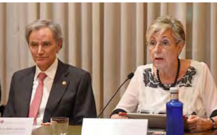
La Magistrada y Vicepresidenta del Tribunal Constitucional dio la lección inaugural del curso 2018-19 de la Academia Vasca de Derecho (AVD-ZEA), que llevó por título “Familia y derechos fundamentales”. En la foto junto al decano de los notarios vascos Diego Granados de Asensio.

Un cuadro con los magistrados del Tribunal Constitucional preside el despacho de Encarna Roca.