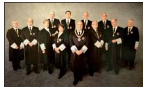
Un cuadro con los magistrados del Tribunal Constitucional preside el despacho de Encarna Roca.