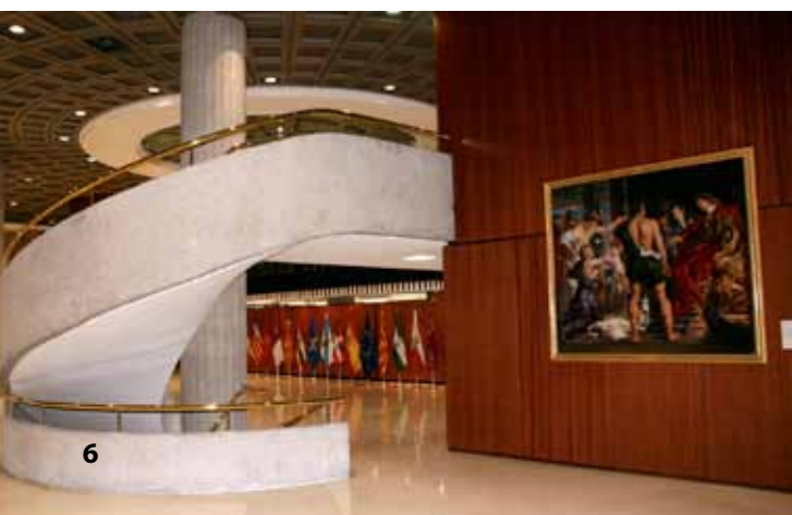
Las banderas de todas las Comunidades Autónomas forman fila en el vestíbulo del Tribunal Constitucional, escoltando a las enseñas de España y de la Comunidad Europea. En un costado, puede verse el óleo El juicio de Salomón , del taller de Pedro Pablo Rubens (1577-1640), y procedente de la Colección Real del Palacio de La Granja de San Ildefonso. El cuadro muestra el momento en que el monarca hebreo ordena partir al niño y repartirlo entre las dos presuntas madres, un ejemplo de la atracción que el rey Salomón ejercía sobre el mundo del Barroco como modelo de sabiduría y buen gobierno.