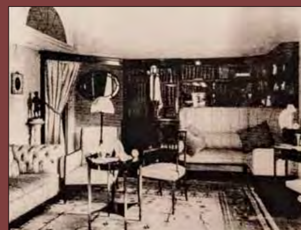
Sala de estudio

El Palacio desempeñó su función como Gobierno Civil hasta 1997, año en el que pasó a albergar la Subdelegación del Gobierno de España en Bizkaia. Y así ha llegado hasta nuestros días, como orgullo de todas y todos los vizcaínos a los que pertenece, y a los que se abre para dejar de ser esa presencia hermosa pero desconocida. ■